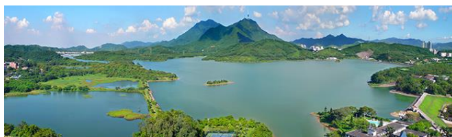
The Dongshen Water Supply Project (Quelle Guangdong Investment Ltd.)

Wir haben die Aktiengesellschaft, welche 1973 in Hong Kong gegründet und gelistet wurde, seit 2009 im Portfolio und ab 2013 stetig aufgestockt. Dies führte zu einem Einstandspreis von durchschnittlich HKD 8.23. Die Aktie mit einer DR von +3.6% ist im Hang Seng China-Affiliated Corp. Index und im Hang Seng Composite Industry Index - Utilities enthalten und investiert auch in andere Infrastrukturprojekte wie Strassen / Brücken, Energie und Immobilien.